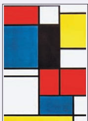
Elements i formes geomètriques bàsiques