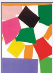
Triangles i quadrilàters